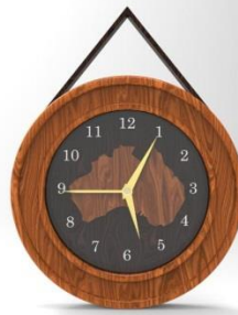
Gambar 3. Tampak Depan