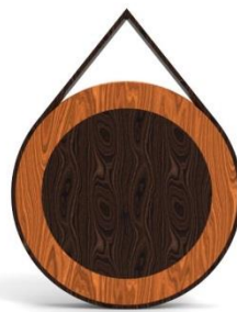
Gambar 4. Tampak Belakang