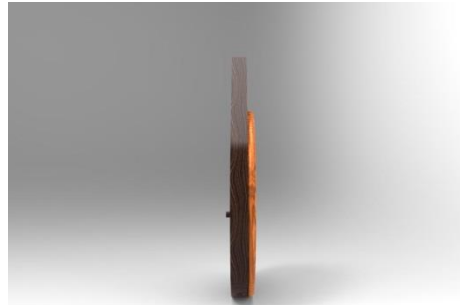
Gambar 5. Tampak Samping