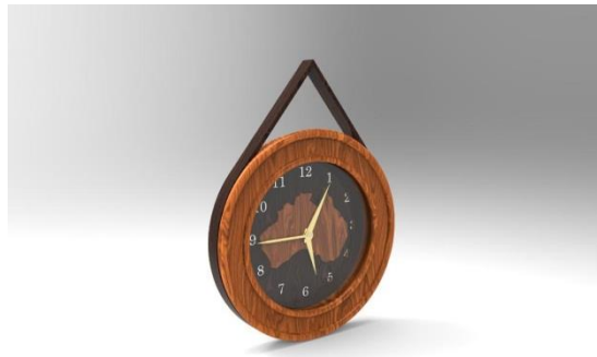
Gambar 2. Tampak Isometri

Berdasarkan hasil dari metode-metode yang digunakan, maka didapatkan hasil berupa desain produk jam dinding yang sudah sesuai, yaitu dapat dilihat pada Gambar 2. Hingga Gambar 6. dibawah ini.