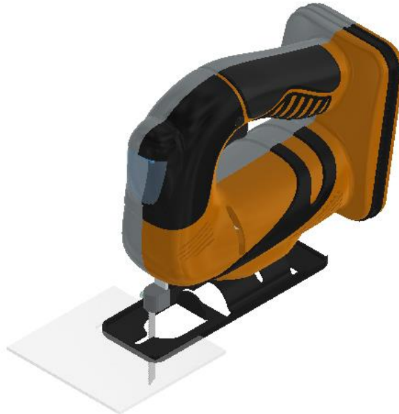
Gambar 2. Alternatif 1 pada jigsaw

Gambar 1 merupakan usulan desain untuk cover jigsaw dan penambahan pada jigsaw sebagai pelindung dari debu dan percikan potongan. Pada alternatif pertama ini yaitu dibuat dari bahan akrilik sehingga alat bantu ringan dan tetap kuat untuk menahan serbuk debu yang beterbangan. Model ini memiliki keunggulan keringanan pada alat cutting jigsaw dengan menggunakan 3M sehingga alat bantu dapat melekat padaudukan jigsaw . Alat bantu ini ringan akan tetapi akan mengalami banyak getaran selama proses pemotongan.