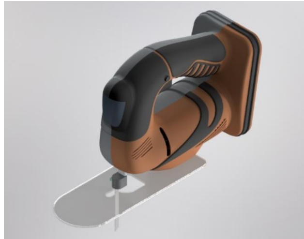
Gambar 4. Alternatif 2 pada jigsaw

Gambar 2 merupakan usulan desain alternatif kedua yang digunakan untuk alat cutting jigsaw sebagai pelindung untuk serbuk debu yang beterbangan. Pelindung yang digunakan pada alternatif kedua ini terbuat dari bahan akrilik sehingga lebih ringan dan tetap kuat untuk menahan serbuk debu yang beterbangan ke arah muka. Model ini memiliki keunggulan pada penyangga yang digunakan kepada alat cutting jigsaw dengan menggunakan baut M6 sehingga lebih kuat untuk menahan getaran pada alat tersebut. Lubang yang tersedia untuk melindungi mata pisau bersifat paten (tetap) sehingga akan tetap aman ketika terjadi kesalahan teknis. Desain pelindung ini memiliki ukuran 245 x 90 mm dengan tebal 3 mm dengan bahan akrilik transparan sehingga tetap ringan dan tidak mengganggu penglihatan dalam melakukan proses pemotongan.