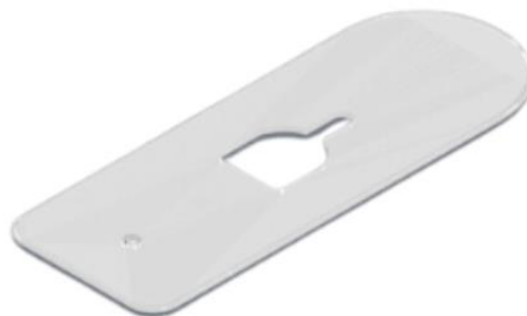
Gambar 3. Alternatif 2