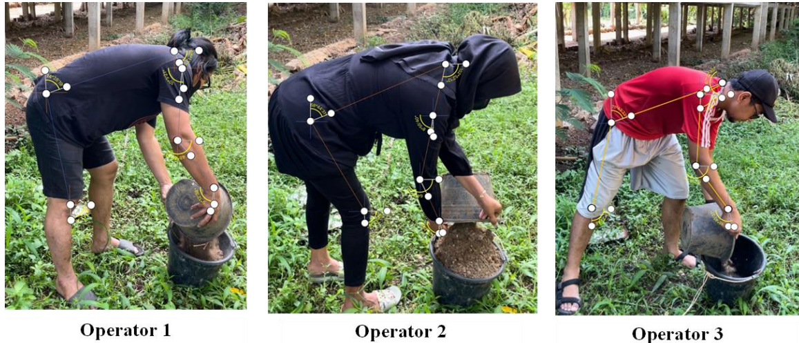
Gambar. 1 Sudut Pengukuran REBA pada Operator 1, 2, dan 3.

ayam memerlukan kehati-hatian dan ketelitian agar prosesnya berjalan lancar dan higienis. Setelah menjalankan tugas selama periode kerja, operator memanfaatkan waktu istirahat selama sekitar 2 jam untuk meregenerasi tenaga, memulihkan kondisi fisik, dan mempersiapkan diri untuk kembali menjalankan tugas dengan efisiensi optimal.