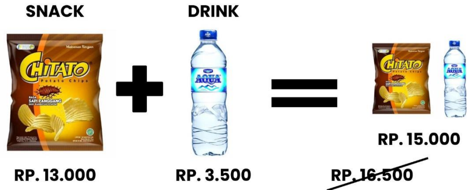
Gambar 3. Contoh Bundling produk yang dapat diterapkan

11, 12. Sehingga knowledge yang dihasilkan dapat diinterpretasikan ke dalam bundling produk, bundling produk ditentukan dengan mengelompokkan produk di departemen yang memiliki rule yang valid . Contoh pada rule 12 bundling produk yang dapat ditentukan yaitu produk chitato (departemen 2) dengan produk aqua (departemen 1) dapat dilihat pada Gambar 3.