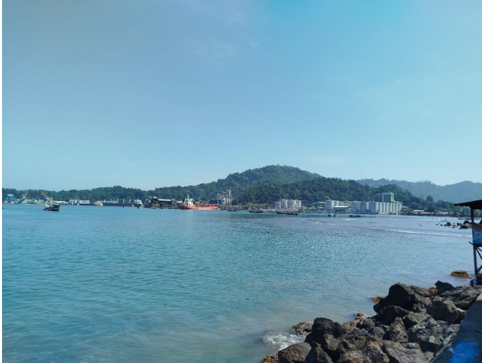
Gambar 1. Pelabuhan Teluk Bayur

Fasilitas persediaan air pada saat awal dibangun tersedia dengan kecepatan 25 ton per jam (416 liter per menit). Mengingat lokasi pelabuhan teluk bayur jauh dari sungai tentu air diperoleh dari mata air disekitar kaki bukit di sekeliling Teluk Bayur. Namun kondisi demikian tidak dimungkinkan lagi, karena berbagai fasilitas alam tidak lagi tersedia, dan lingkungan sudah dipenuhi oleh penduduk. Sehingga untuk persediaan air pelabuhan di suplai oleh PDAM. Air yang diperoleh dari PDAM disimpan melalui tangki tandon yang berjumlah 6 buah dengan kapasitas 1500 liter per unit dan saat sekarang disuplai 166 liter per menit di kali dua dengan menggunakan pompa air.